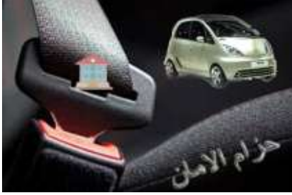
تصميم ملصق إعلان حزام الامان

فكرة الملصق: إعلان إستخدام حزام الأمان أثناء ركوب السيارة الدلالة البصرية: صورة للسيارة وهي تسير على الطريق بهيئة حزام الأمان أسود اللون الدلالة الرمزية: شكل المنزل في منتصف الحزام باللون الأحمر المضيء للتذكير دائماً بلحظة الوصول بأمان إلى العائلة وربط الحزام يؤدي لذلك