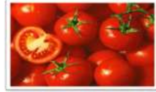
الشكل الطبيعي للطماطم