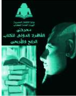
ملصق إعلان معرض القاهرة الدولي للكتاب

فكرة الملصق: الإعلان عن معرض القاهرة الدولي للكتاب الدلالة البصرية: صورة لوجه تمثال رمسيس في إضاءة ليلية ، وأشكال عديدة للكتب الدلالة الرمزية: تمثال رمسيس الثاني رمز لمصر الحضارة والإضاءة على وجهه رمز التنوير ، وشكل الكتب رمز للمعرض والتجمع الثقافي للكتاب