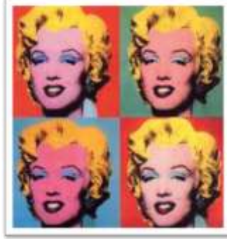
شكل (٩) اندي وار هول صورة مزدوجة لمارلين مونرو ، طباعة بالشاشة الحريرية

إلى إضافة ضربات الفرشاة الجريئة ، وتقنيات الطباعة المختلفة مزاجية بطرق الإلصاق والكولاج ، لقد أعتقد انه " كلما استخدم الفنان الأشياء و العناصر في عمله من العالم الواقعي ، يصبح أكثر واقعية.