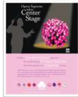
شكل (٤) ملصق ثقافي يوضح اعلان حفل موسيقي