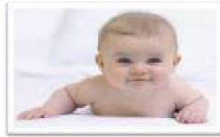
شكل الطفل الصغير