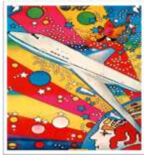
شكل (٥) ملصق سيلاحي ، " بيتر ماكس " Peter Max